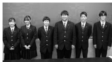
【野口英世賞受賞メンバー】

SSH探求部のダンゴムシ班（3年生4名、2年生2名）が福島県 高校生の科学・技術研究論文 野口英世賞の高校共同研究部門において最優秀賞を受賞しました。この研究ではダンゴムシの腸内から取り出した複数のセルロース分解菌の中から、特に分解能力の高い菌を発見しました。また、ブドウムシ班は、ブドウムシの腸内からプラスチック分解菌を効率よく取り出して培養する研究で、福島県生徒理科発表会のポスター部門で最優秀賞、生物部門で優秀賞を受賞し、来年度の全国総文祭への出場が決定しました。関係する皆様にはお世話になりました。